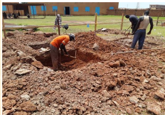
Fundamentarbeiten für das Lycée in Esther 1 im Sept. 2020