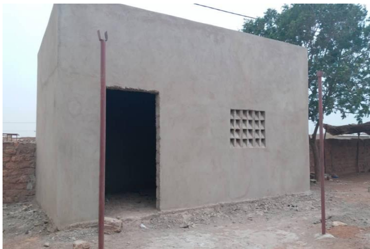
Neues Küchengebäude in Esther 2

In der Oktoberausgabe 2019 berichteten wir von dem geplanten Küchengebäude für Esther 2, das Schutz vor Regen geben soll. Dank Ihrer großartigen Unterstützung wurde das Gebäude im April 2020 für ca. € 1.400,- errichtet. Die Ausgaben für dieses Gebäude wie auch die Verwendung unserer Überweisungen für die Schul-