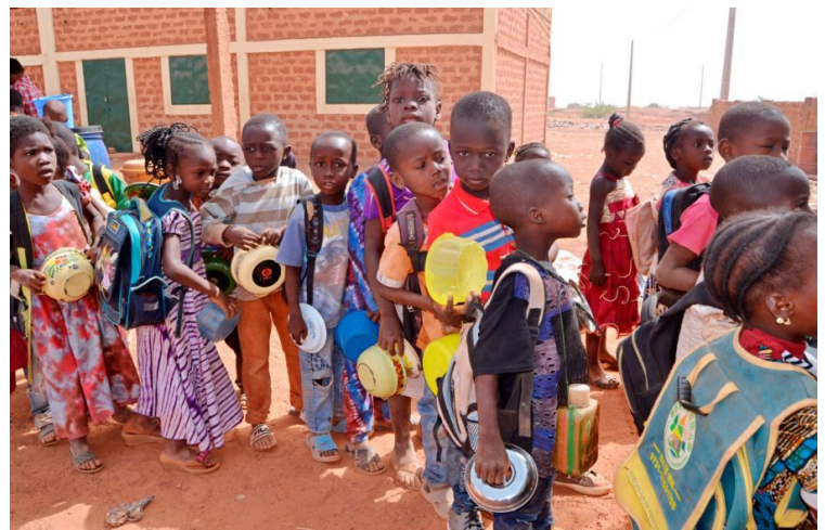
Essensausgabe in Esther 2

speisung wurden ordnungsgemäß belegt. Vor Ort unterstützten uns Tanja Osterried und ihr Mann weiterhin bei der Überwachung der eingesetzten Gelder bzw. ingenieurtechnisch und preislich korrekten Abwicklung der Bauprojekte.