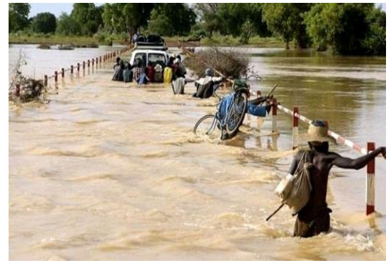
Überschwemmungen in Burkina Faso ab Juli 20